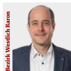
Bezirk Westlich Raron