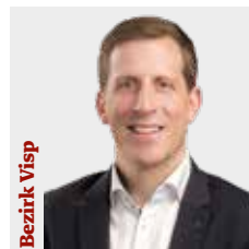
Flavio SCHMID Abgeordneter NEO