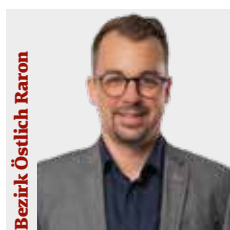
Bezirk Östlich Raron